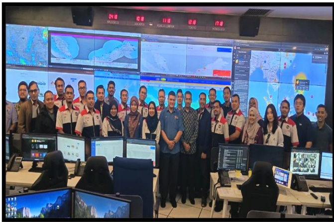
LAWATAN AKADEMIK DARI UNIVERSITI PUTRA MALAYSIA