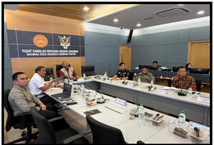
TINJAUAN PENGOPERASIAN STATE DISASTER COMMAND CENTRE (SDCC) NEGERI SARAWAK