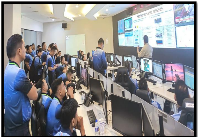
LAWATAN DARI MAKTAB POLIS DIRAJA MALAYSIA (PDRM)