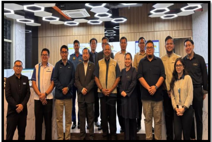
TINJAUAN PENGOPERASIAN STATE DISASTER COMMAND CENTRE (SDCC) NEGERI SABAH

BEAUFORT, TENOM & TAMBUNAN, SABAH | 10 - 11 JANUARI 2026