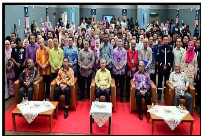
MAJLIS AMANAT TAHUN BAHARU 2026 YAB TIMBALAN PERDANA MENTERI BERSAMA WARGA NADMA