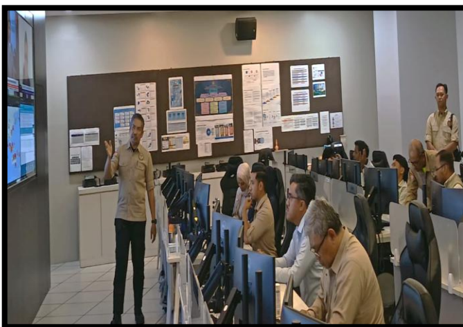
LAWATAN DELEGASI BAHAGIAN KESELAMATAN DAN KETENTERAMAN AWAM (BKKA), KEMENTERIAN EKONOMI