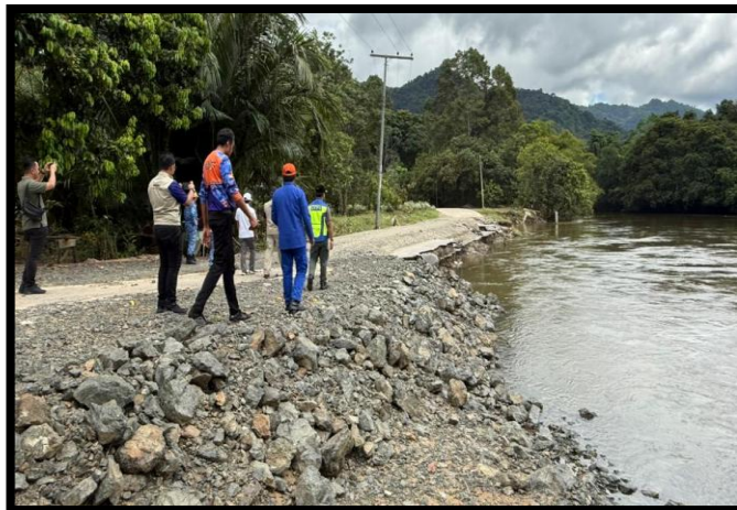
TINJAUAN LAPANGAN DI LOKASI BENCANA BANJIR MONSUN TIMUR LAUT (MTL) 2025/2026