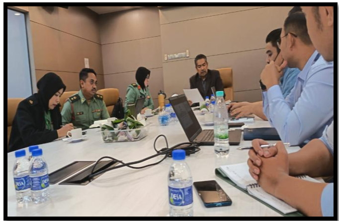
MESYUARAT BERSAMA JABATAN UKUR DAN PEMETAAN MALAYSIA (JUPEM) DAN ESRI MALAYSIA