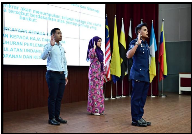
PERHIMPUNAN BULANAN AGENSI PENGURUSAN BENCANA NEGARA (NADMA) BIL. 1 TAHUN 2026