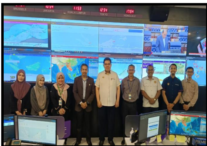
PERBINCANGAN PROSEDUR TETAP OPERASI (PTO) ANGKASA BERSAMA BAHAGIAN PENGUASA ANGKASA, MOSTI