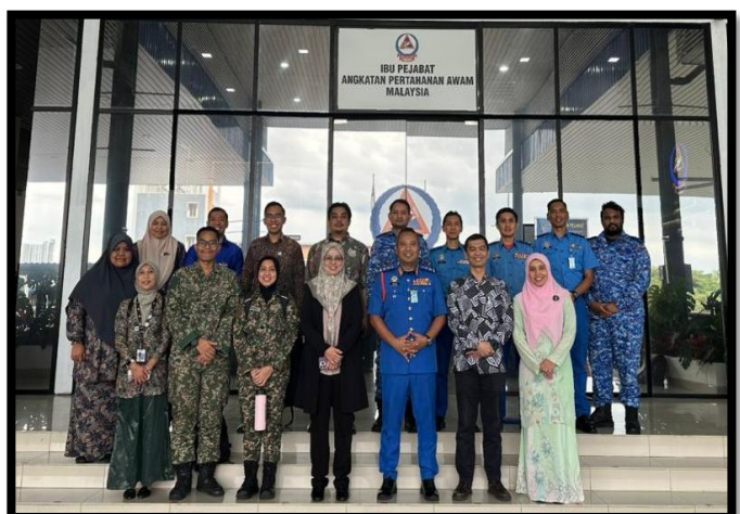
MESYUARAT PERBINCANGAN PROJEK PENAMBAHBAIKAN PUSAT KAWALAN OPERASI PUSAT (PKOP) APM