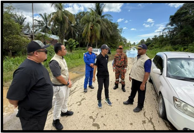
TINJAUAN LAPANGAN DI LOKASI BENCANA BANJIR MTL 2025/2026 DAN LOKASI PEMASANGAN BAILEY BRIDGE

BEAUFORT, TENOM & TAMBUNAN, SABAH | 10 - 11 JANUARI 2026