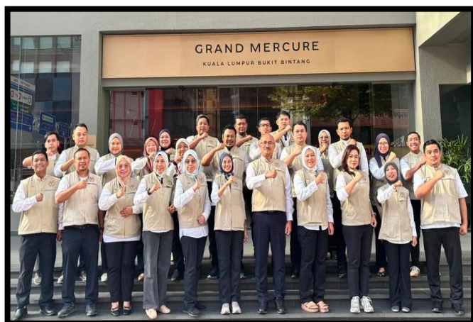
BENGGEL PENGUKUHAN STRATEGIK AGENSI PENGURUSAN BENCANA NEGARA (NADMA) PERINGKAT PELAKSANA TAHUN 2026

GRAND MERCURE, KUALA LUMPUR | 9 - 11 JANUARI 2026