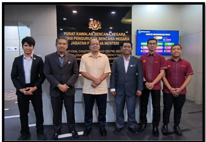
PERBINCANGAN BERSAMA MALYSIAN AMATEUR RADIO TRANSMITTERS SOCIETY (MARTS)